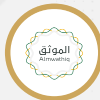
الإدارة العامة للموثقين